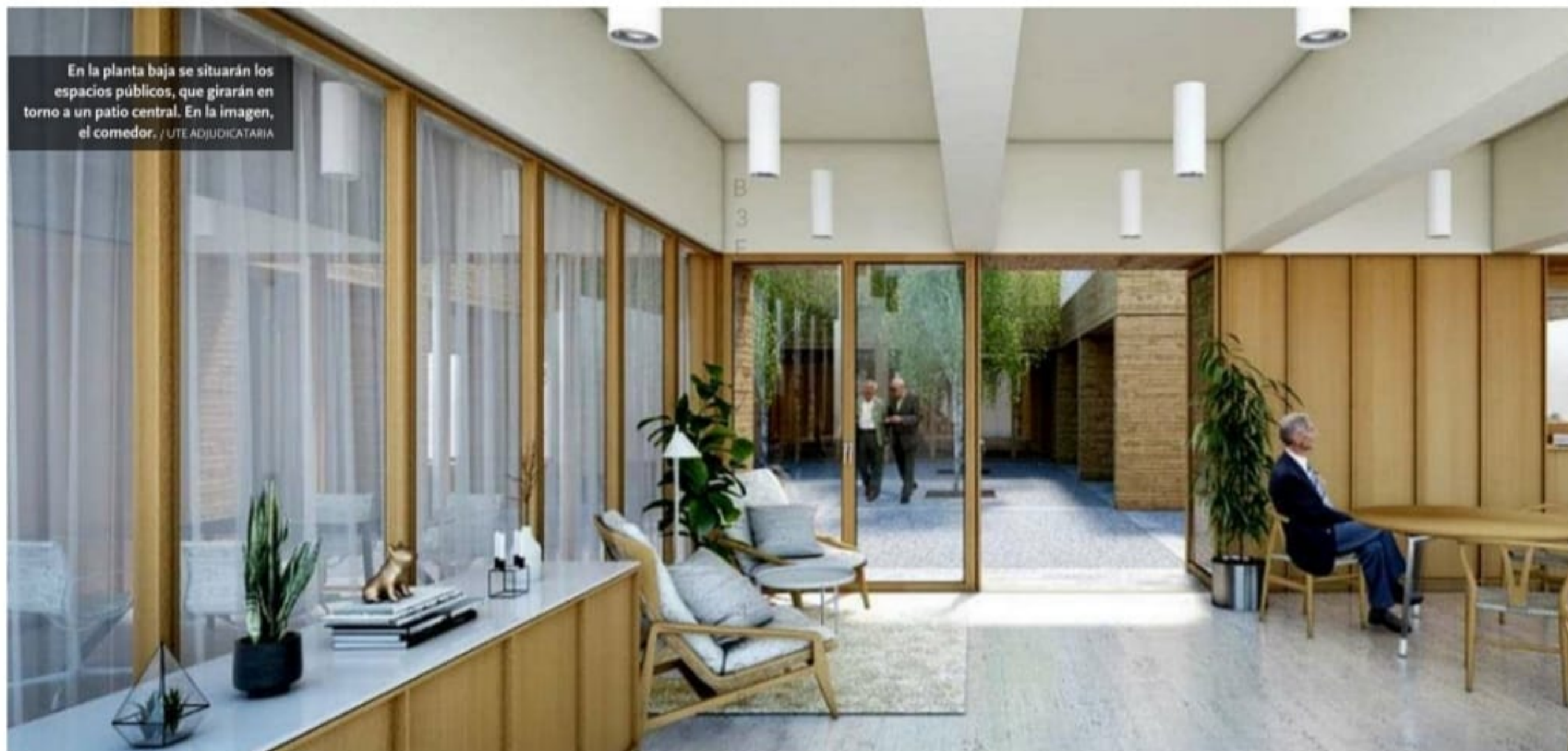
En la planta baja se situarán los espacios públicos, que girarán en torno a un patio central. En la imagen, el comedor.