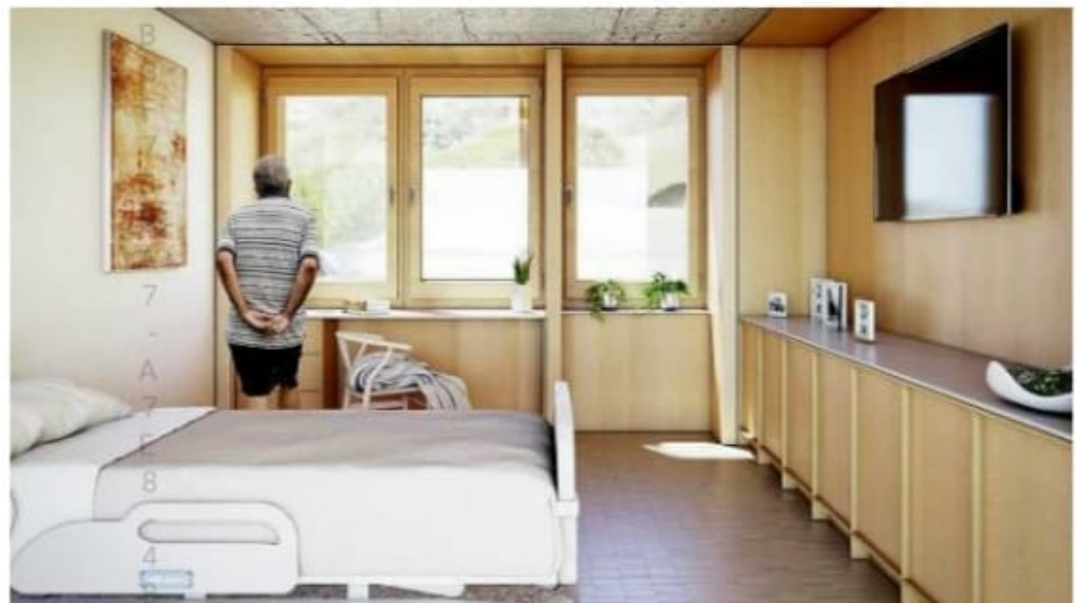
Habitación tipo de la residencia de mayores, según la memoria presentada por el equipo de arquitectos.

Así, este proyecto resolverá, por un lado, la atención a los mayores en San Esteban del Valle, con la construcción de un edificio multidisciplinar que albergará dos unidades de convivencia para 32 residentes y una unidad de Centro de Día para 16 personas y, por otro lado, ofrece la posibilidad de tener es-